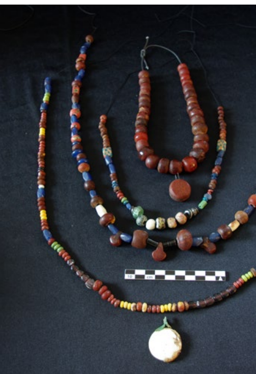
Foto: Varde Museum. Spande af takstræ med bronzebeslag, smykker og perler er alle fundet i de rige kvindegrave, de daterer sig til yngre romersk jernalder ca. 200-400 e.Kr.